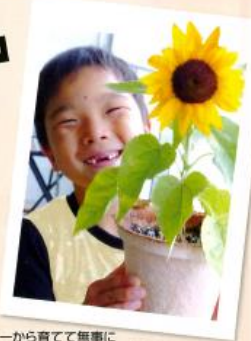
一から育てて無事に咲いたときの子どもの笑顔を見て、成長を感じることができました。