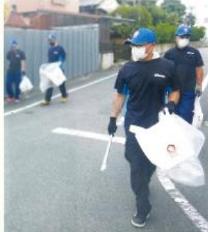
複数のグループに分かれてゴミの収集量を競っています。