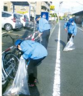
ひとつでもごみが落ちていたら次から次へと捨てられるので、すぐに拾って地域の皆さんが気持ちよく利用できるようなっています。