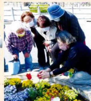
花壇の手入れをしていると声をかけられたり、花の写真撮っていただく方もいて、やりがいを感じています。